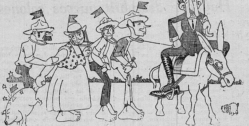
EL GAMONAL:—Ahí mando esos voluntarios, devuélvame las sogas.

Informa un diario que son numerosos los distritos en los cuales los vecinos, de uno y de otro partido, se resisten a figurar como integrantes de las mesas de votaciones. En esta situación los gamonales interesados han cfrécido enviar trabajadores de sus fincas.